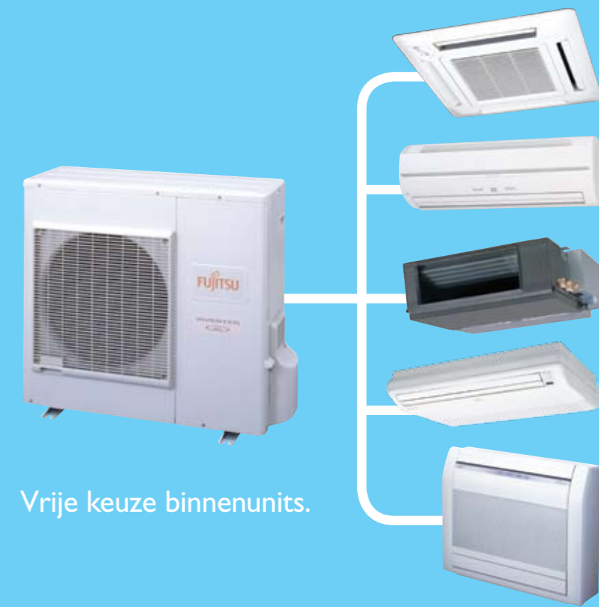
Vrije keuze binnenunits.

De unit wordt geleverd in de warmtepompuitvoering en kan dus koelen of verwarmen. Het inverterprincipe zorgt voor een modulerende capaciteitsregeling. De unit past zich perfect aan de capaciteitsbehoefte van de ruimte aan. Hierdoor wordt aanzienlijk op energie bespaard en geen onnodige energie verspeeld. Dit resulteert in een laag energiegebruik en een hoge energieklasse. De unit bereikt twee keer zo snel de ingestelde ruimtetemperatuur en varieert daarna nauwelijks. Wanneer de ruimtetemperatuur stabiel is, draait de compressor op laag toerental. Dit betekent in de praktijk een stuk minder lawaai.